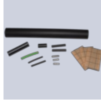
Samlingssæt ELVB-SRV- Ramp